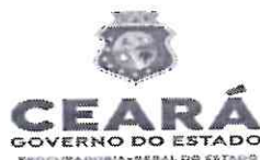
TABELA DE LANCES - RDC 20210003 – SEDUC

OBJETO: LICITAÇÃO DO TIPO MAIOR DESCONTO PARA CONCLUSÃO DA CONSTRUÇÃO DE UM CENTRO DE EDUCAÇÃO INFANTIL – CEI – BARBALHA – CE