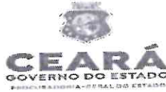
TABELA DE LANCES - RDC 20210004 - SEDUC

OBJETO: LICITAÇÃO DO TIPO MAIOR DESCONTO PARA CONCLUSÃO DA CONSTRUÇÃO DE UM CENTRO DE EDUCAÇÃO INFANTIL - CEI - MAURITÍ - CE.