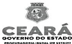
TABELA DE LANCES – LICITAÇÃO Nº 20240019 – CEGÁS

LICITAÇÃO COM CRITÉRIO DE JULGAMENTO MENOR PREÇO PARA CONTRATAÇÃO DE SERVIÇOS DE ENGENHARIA PARA GASODUTOS EM REDES DE POLIETILENO DE ALTA DENSIDADE EM 32, 63 E 90MM, PARA ATENDIMENTO AO DISTRITO PORTO DAS DUNAS E AV. BEIRA MAR - FORTALEZA E REGIÃO METROPOLITANA.